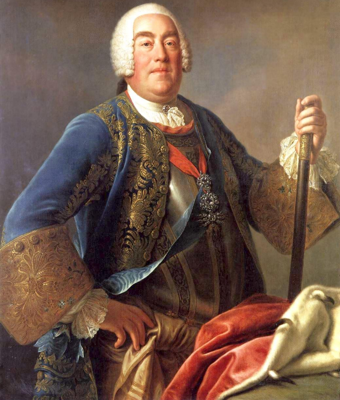
Pietro Rotari "August III Sas", 1755 r.

"Dobry pan ze wszech miar August III był tak nieszczęśliwy, że za jego panowania trzydziestoletniego żaden sejm nie doszedł. Prawdać to jest, że król sam przez się nie wdawał się w interesa państwa szczególnie, ale ile tylko mógł, starał się ogólnie, żeby Rzeczpospolita z nieładu dawnego przyszła do sprawy i do aukcji wojska."