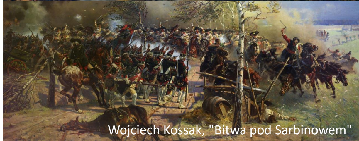
Wojciech Kossak, "Bitwa pod Sarbinowem"