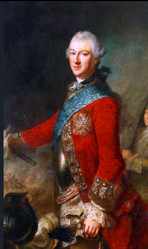
Michał Kazimierz Ogiński pochodzący z rodu Czartoryskich, żyjący w czasach panowania Augusta III

"Dom Czartoryskich, zakrawając z daleka na detronizację Augusta, aby zepchnąwszy go z tronu osadził na nim swego najmilszego Adasia, wojewody ruskiego syna (...), zrywał sejmy przez subordynowane osoby, zwałając winę na króla, utyskując na jego nieszczęśliwe panowanie, że nie masz w kraju żadnego rządu, że król jak bałwan bez znajomości interesów publicznych o niczym nie wie, na niczym się nie zna, że cały rząd królestwa oddał jednemu ministrowi, swojemu ziomkowi Sasowi"