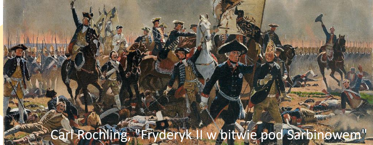
Carl Rochling, "Fryderyk II w bitwie pod Sarbinowem"

"Przyczyny używane do zerwania sejmu bywały czasem pozorne, jaka była natenczas, kiedy Moskwa, wojując z królem pruskim, rozpościerała się po całej Polsce. Zrywacze sejmu użyli pretekstu tego, iż pod bronią obcego żołnierza wolność jest przyciśniona, a zatem sejm wolny być nie może, więc żaden być nie powinien."