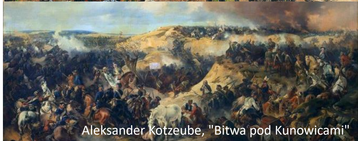
Aleksander Kotzeube, "Bitwa pod Kunowicami"